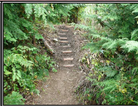
伐採木を利用した階段杭