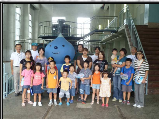
水力発電所見学会の様子