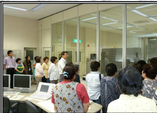
制御所見学会の様子