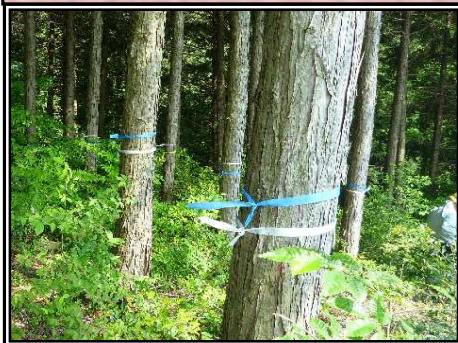
伐採テープ(環境配慮タイプ)

時間の経過とともに自然に土に帰る伐採テープの使用や、伐採木を再資源化するなど、環境に配慮した資材を使用するよう取り組んでいます。