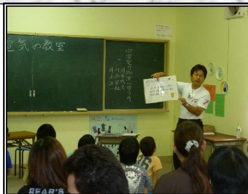
わくわくEスクールの様子