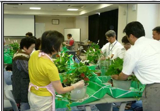
ガーデニング教室の様子