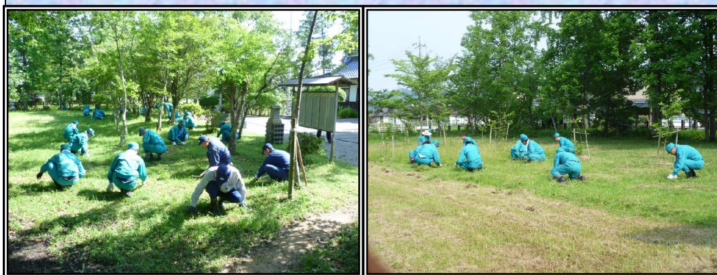
作楽神社清掃の様子

津山電力所では地域の皆さまへの感謝の気持ちをこめて, 平成12年から継続して清掃活動を行っています。