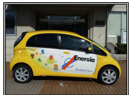
津山電力所に導入された電気自動車

実施結果をもとに評価・見直しを行い、継続的な改善につなげて、環境負荷のさらなる低減に努めていきます。