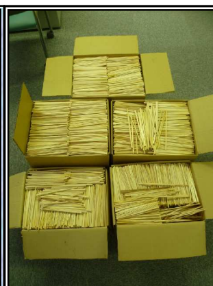
王子製紙さんへ送った 使用済み割り箸 (約90kg)

また, 近年「My箸運動」を展開しています。なるべく割り箸の利用を避け, 資源を大切にしようという目的で始め, 使用済み割り箸の量も激減しています。