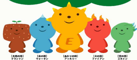
【大地の精】グラントン 【水の精】ウォーターン 【あかりの精】アッカリーン 【火の精】ファイアン 【空の精】スカイン

『私たち岡山電力所は 地球環境を大切にし 地域のみなさまとともに 明るい未来を創ります。』