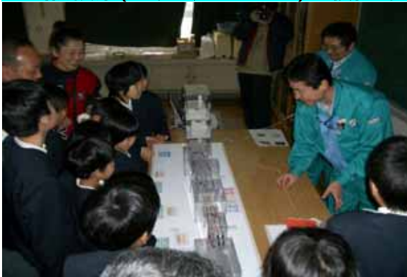
小学校での授業風景 (電気が届くまで)

電力所の積極的な取り組みとして、2006年度は小・中学生を対象に69回(2,240名)の出前授業(わくわくEスクール)を実施しました。毎回テーマを決めて、学年に応じた内容の授業を実施するよう心がけています。また、おもしろ電池などの実験装置も手作りし、子ども達にわかりやすい授業になるよう工夫しています。