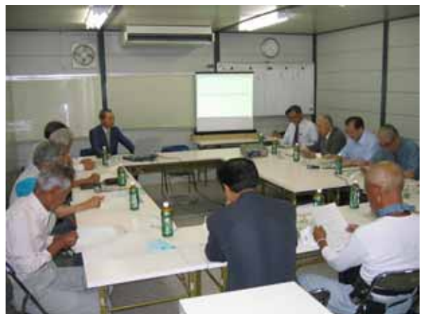
(委員会の開催風景)