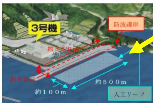
図1. 島根原子力発電所3号機北側人工リーフ鳥瞰図