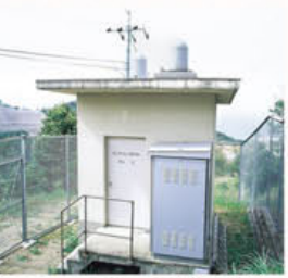
モニタリングポスト

発電所周辺の6か所に空気中の放射線を測るモニタリングポストを設置し、24時間監視しています。また自治体でも独自に設置されています。