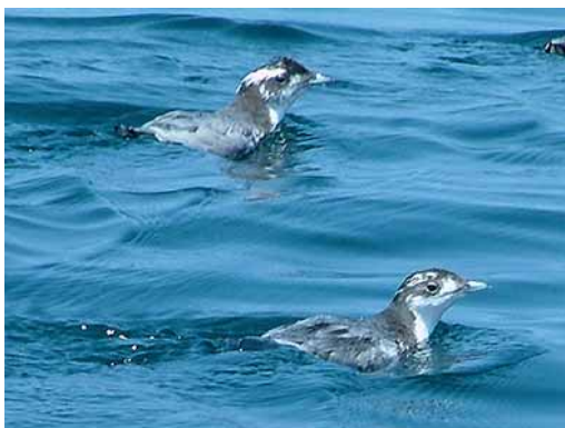
図1．カンムリウミスズメ

文献を収集・整理すると共に,本種の調査研究に従事されている学識経験者に聞き取り調査を行った。