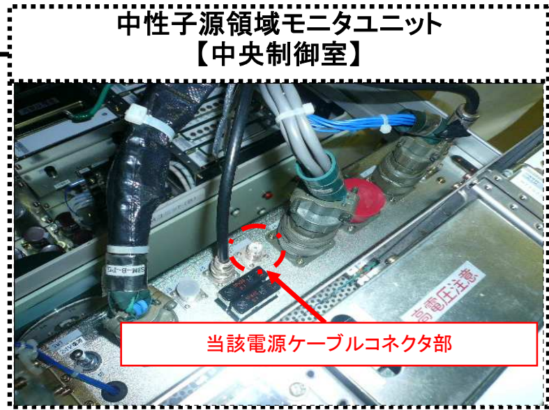
(同一型式の予備ユニットの写真)