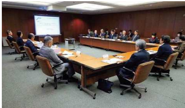
環境懇話会の様子

また、当社グループの環境への取り組みについて、社外の有識者を委員とした「中国電力環境懇話会」を設置し、いただいた評価や意見を事業活動に反映しています。