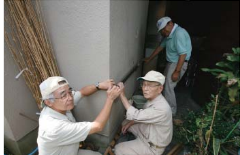
高齢者の家庭内事故防止のために住宅を改修するNPO法人ディヘルプ

「市民とのあるべき協働」の実現を目指す我孫子市。 そこでは、「協働とは対等な立場で共通の目標に向けて協力すること」という理念のもと、 自立したNPOと行政が、 それぞれの長所を活かしながら魅力あるまちづくりを展開している。