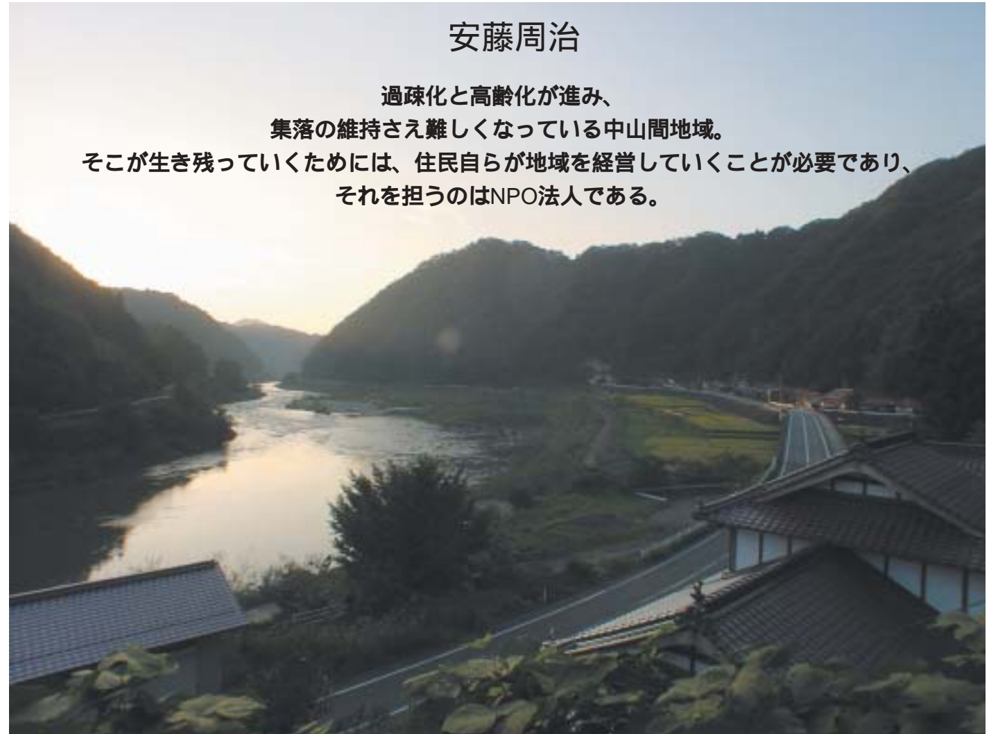
中国山地を流れる江の川沿いの集落

過疎化と高齢化が進み、 集落の維持さえ難しくなっている中山間地域。 そこが生き残っていくためには、住民自らが地域を経営していくことが必要であり、 それを担うのはNPO法人である。