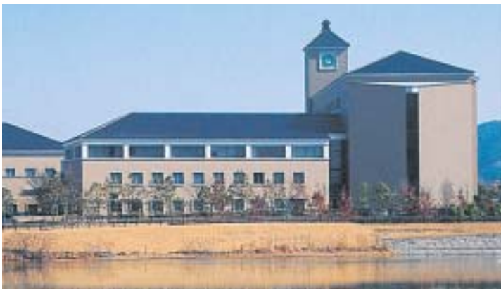
日本で唯一の酒に関する研究機関の酒類総合研究所

さらに、自動車関連では、フォード・モーター・カンパニーの社内分社として誕生し、現在は分離・独立しているヒステオン・ジャパン株式会社東広島事業所も立地している。