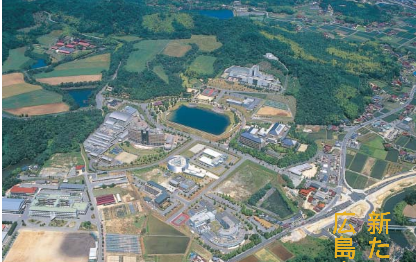
東広島市の郊外に広がる広島中央サイエンスパークの全景

一方で、広島中央サイエンスパークには、企業の研究所も立地している。その一つが、情報通信分野のソフトウェア開発を行っている株式会社松下電器情報システム広島研究所である。一九九八（平成十）年に広島市から