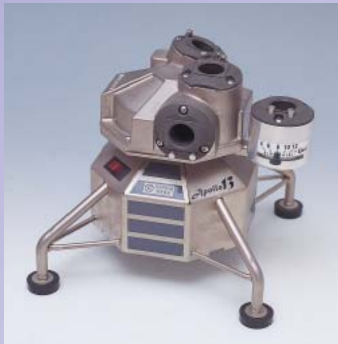
2003年度のグッドデザイン賞に輝いた「アポロ13」(エンドミル研磨機)(左)と、ドリル研削機

社屋から大山を仰ぎ見る新井社長の目からは、新たな挑戦に燃える企業家魂が伝わってきた。