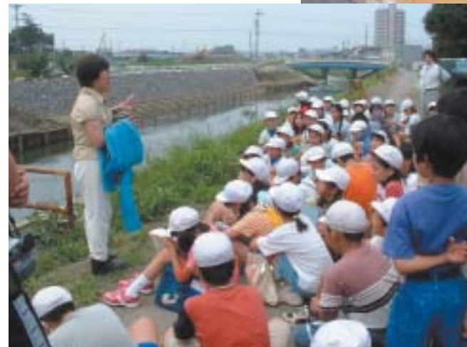
川の役割を現地で学ぶ。

住民主体の地域づくりを目指す 浜松NPOネットワークセンター。 ここでは三つの事業を有機的に絡ませ合いながら、 新しい公共の担い手であるNPOの役割を創造している。