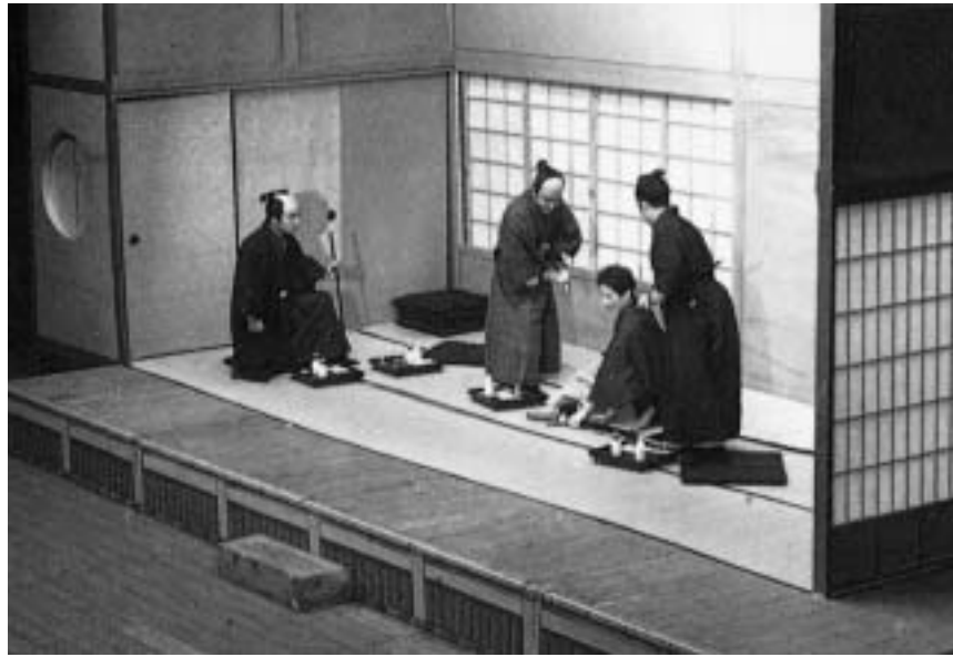
地元・下関における明治維新を劇化し、大きな反響を得た「海峡の黎明」

戦後からわずか八年で、 海峡の街・下関に劇団を結成。 郷土をテーマとした創作劇を中心に、 三百回以上の公演を重ね、 地元文化の発掘・発信に 尽力し続けてきた劇団主宰者は、 創設五十年を経て、 熟年世代の劇団プロジェクトも立ち上げた。