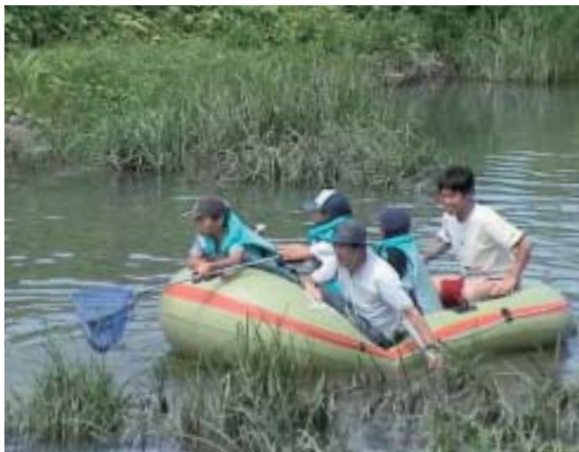
安間川を舞台としたイベントを通じて、市民は多くのことを学んでいった。

NPOネットワークセンターは二年目からは、自主事業として小学校五年生での総合学習との連携事業を展開し、河川だけの問題ではなく、小学校の先生たちを米国のロサンゼルスに派遣してサビスラーニング事業に発展させる事業や、洪水防止と雨水利用によって水循環を保全する雨水マス「溜めタル君」設置事業を併行して実施している。