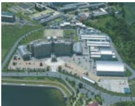
さまざまな研究開発を行っている中国電力エネルギー総合研究所