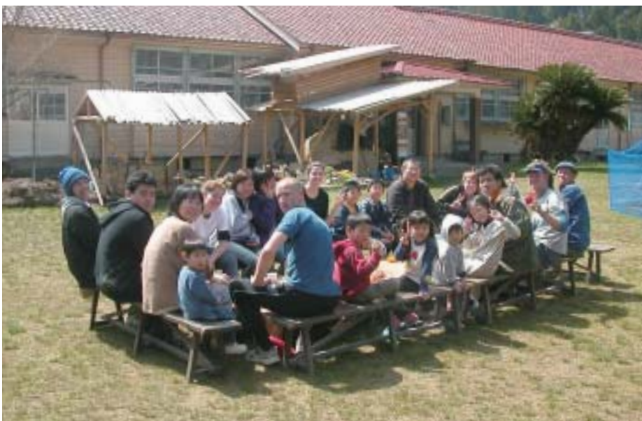
新しい地域交流の拠点となった廃校

紀州山地の山々に囲まれた廃校を拠点とするNPO共育学舎。農業、農村の再生を目指したその活動は着実に地域に根つきながら、NPOのあり方を示唆している。