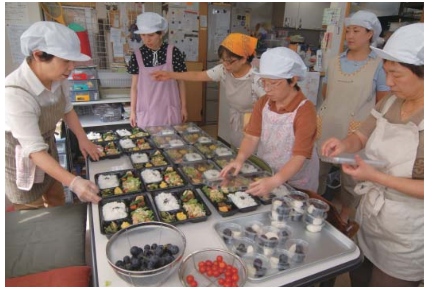
配食サービスを提供するNPO法人

NPOと言われると、多くの人は高齢者介護や環境保護、国際交流などの活動を行う草の根市民団体を思い浮かべるであろう。しかし、それだけではない。学校法人や医療法人、社会福祉法人なども、制度的に利益を分配できないという意味ではNPOの一種と考えることができるし、民法に基づいて設立された財団法