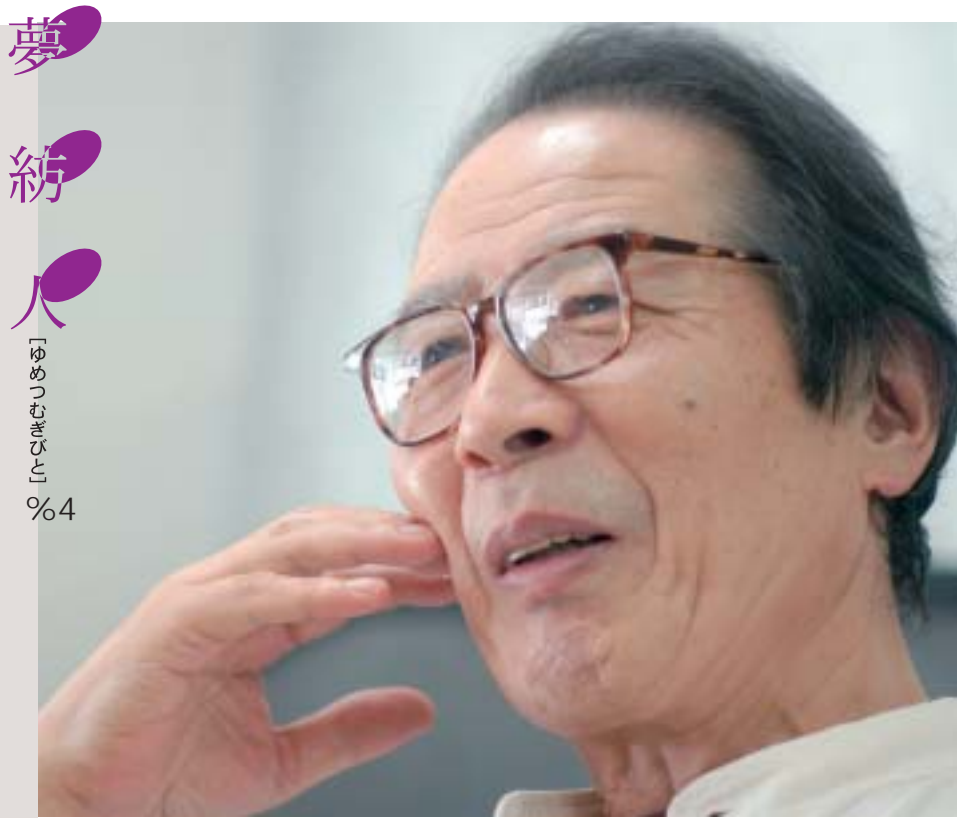
文・村上郁子(山口県高山市在住) 写真・村上征雄(山口県防府市在住)

次の転機となったのは、一九六五(昭和四十)年、地元の同人誌「午後」との提携によるオリジナル劇「海峡の黎明」の上演だった。 折しも、幕末の下関で高杉晋作を支援した豪商・白石正一郎の日記が世に出た頃。その好機をとらえ、白石を物語の中心に据えた脚本を、武部さんと「午後」の同人三人が共同執筆した。三人の中の一人は、後に直木賞を受賞した作家・古川薫氏だった。 同人誌と劇団、二つのグループが手を携えて地元・下関における明治維新の劇化に取り組んだことが注目を集め、初めて演じる市民会館(現・文化会館)の大ホールは、一千人以上の観客で埋め尽くされた。 「おかげで、演劇を漫然とやるのではなく、地元の歴史や人物・気風を掘り起こしていくんだという、私たちの意欲が多くの人たちから認められるようになった」 それは、海峡座のアイデンティティーの確立であり、同時に戦