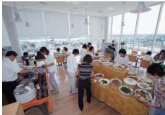
市民事業の一環として有限会社ゆーらんが運営しているレストラン「旬菜ムッターランド」