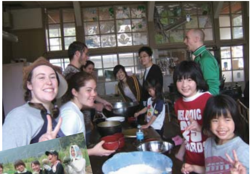
農業体験を通じてさまざまな交流が行われている。

紀州山地の山々に囲まれた廃校を拠点に「元気な田舎づくり」を目指すNPO共育学舎。農業を通じて自分の生き方を考えることを原点とした活動は、地域社会におけるNPOのあり方を示唆している。