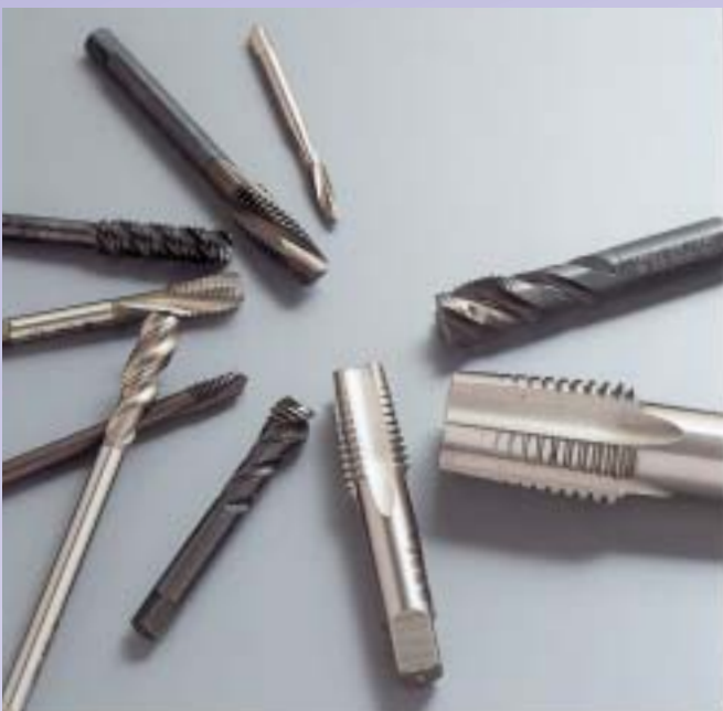
独自の技術で再生したタップ

当然、十分な資金などなかった。融資を受けるために銀行に行き、「オートバイを開発したいんだ。日本一の自動車会社になりたいんだ」と、自分の思いを訴えた。こうして得た二千万円をもとに事業をスタートさせ、二十四歳までに二つの工場を持つまでに成長させた。