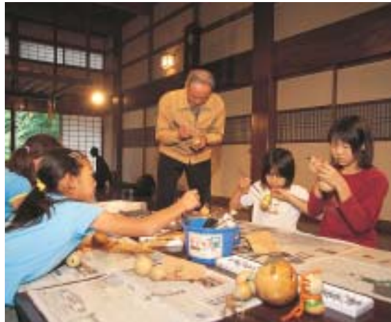
NPO法人による、古民家を使った体験学習

さきほど「NPOの台頭は必然的である」と述べたが、それはNPOなどによって構成される非営利セクターが大きな役割を占める成熟社会に日本が移行しているからである。