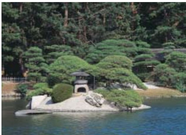
芝生や築山、池などが優雅に配置された園内

早朝から開園（四〜九月は七時三〇分、十〜三月は八時）しているの、朝の散歩にもおすすめです。