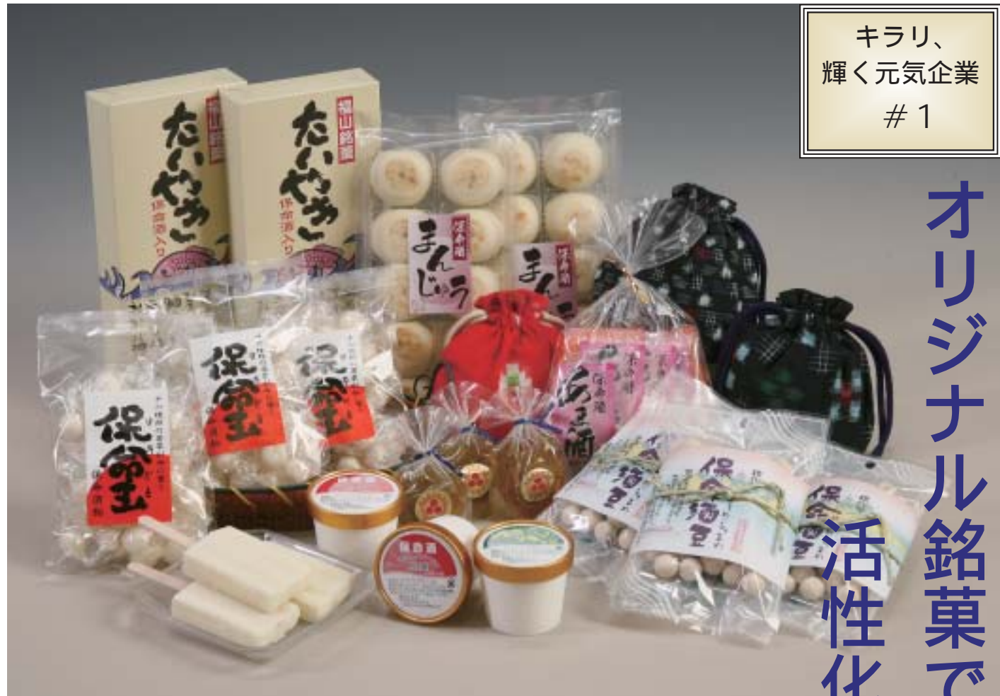
地元の保命酒と産品を使ったオリジナル銘菓の数々

特産品の保命酒をより多くの人たちに知ってもらいつつとも、「地域経済を活性化したい。その思いからスタートしたビジネスモデルは、オリジナル銘菓を生み出しながら、着実に実績を重ねている。」