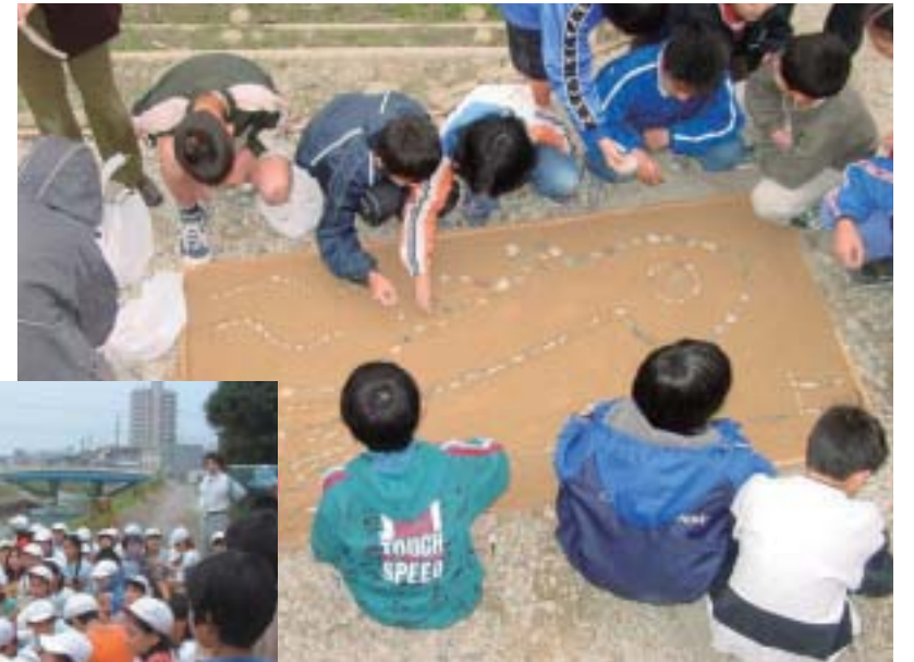
石で魚を描く子どもたち