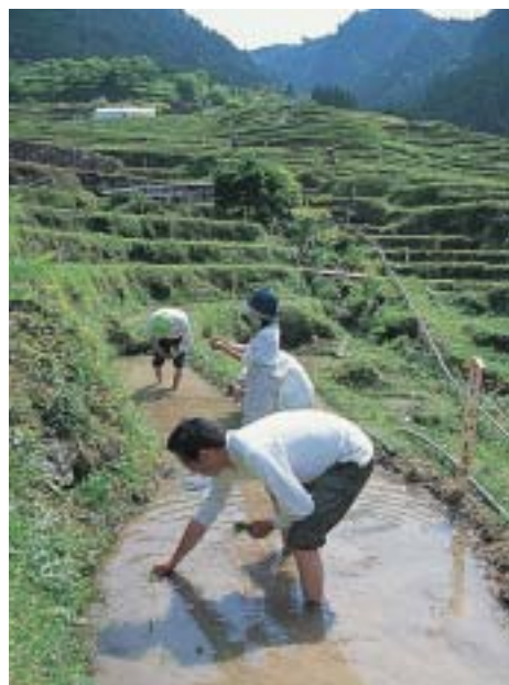
棚田を使って都市との交流を行う NPO法人も増えている。

このようにNPOの存在は、成熟段階を迎えた日本社会にとっては不可欠のものとなっている。しかし、NPO活動の面白さやダイナミズムを生かすためには、政府・行政は「出しゃばり過ぎない」ことが必要である。政府・行政が提供しているサービスを見直し、NPOなどの民間部門に委ねることは協働の重要な第一歩といえる。