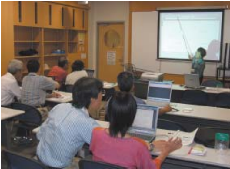
中高年者向けにパソコン講習会などを開催するNPO法人あびこ・シニア・ライフ・ネット

自立を目指すNPOと、NPOとの協働によって魅力あるまちを築こうという我孫子市役所。その取り組みは、着実な効果をもたらしながら、さまざまな分野へと広がっている。