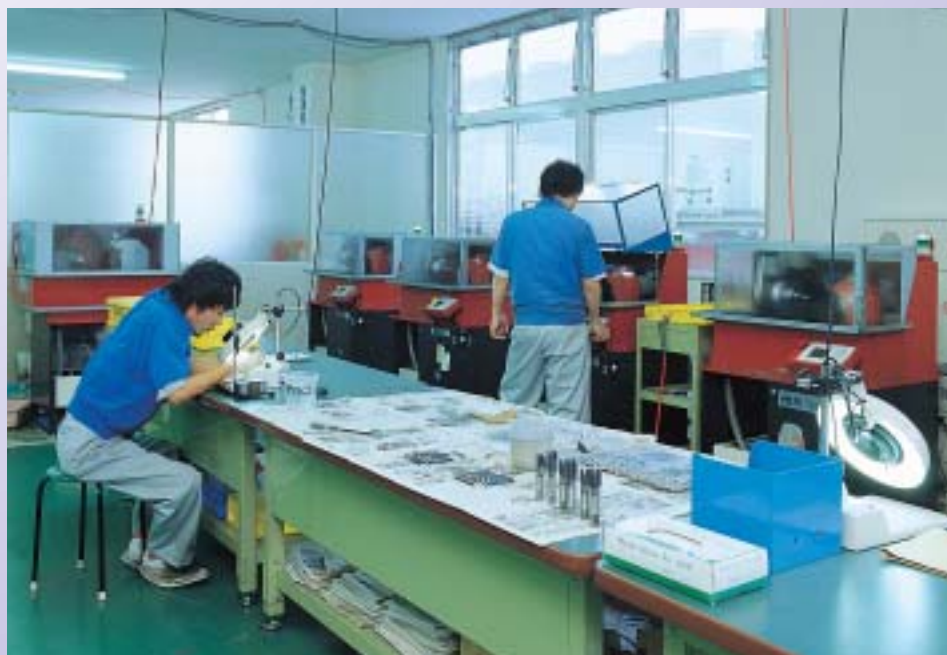
タップ再生事業に取り組む若い技術者たち