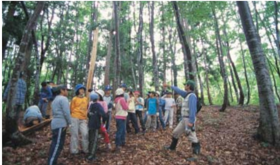
森林の保護活動に汗を流すNPO法人

集落を維持していくために、作木町では、今後の集落のあり方や再編の可能性について議論を重ね、「行