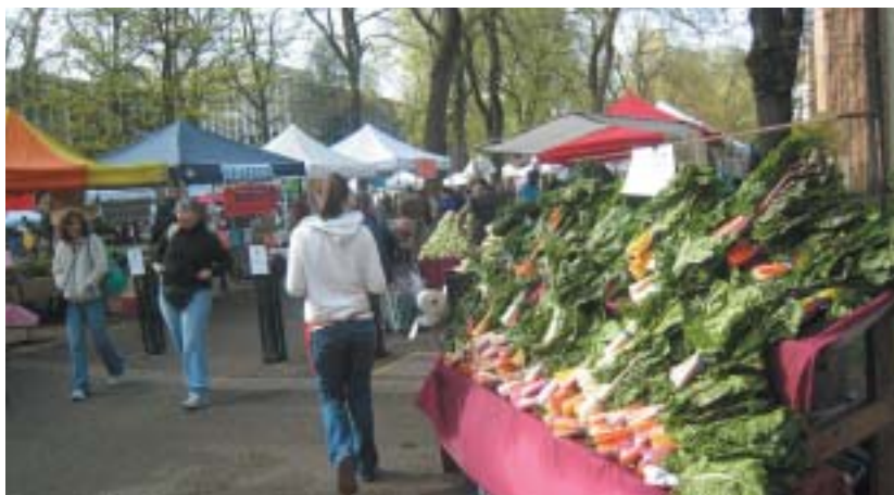
いつも多くの市民でにぎわうポートランドのファーマーズマーケット

商店街のメインストリートとともに、新 しい仕組みづくりも必要である。その 一例が米国オレゴン州ポートランドのま ちづくりへの取り組みである。ポータラ