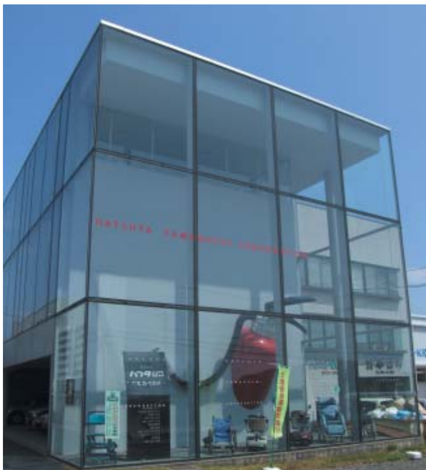
消火器と車いすのディスプレイが印象的なハツタ山口の本社