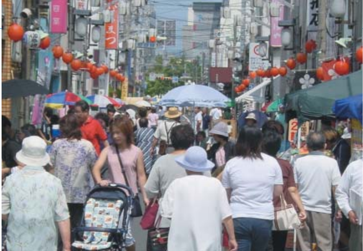
多くの人でにぎわう、毎月25日の天神様の縁日