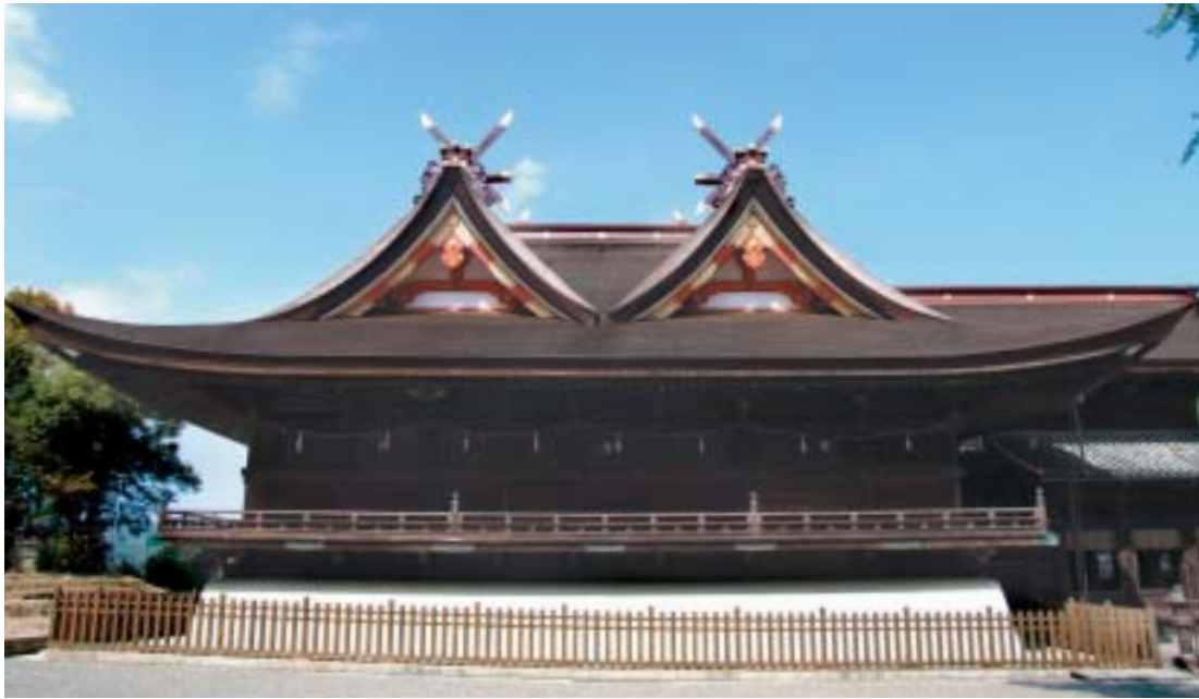
白い基壇の上にある本殿(側面)