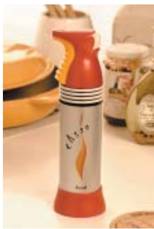
ユニバーサルデザインの発想を取り入れたCASSO

創業時から「人を守る」を理念に掲げるハツタ山口は、「現場」ではぐくまれる人材と、いち早くキャッチした情報で企業価値を高めながら、事業基盤を着実に強化している。