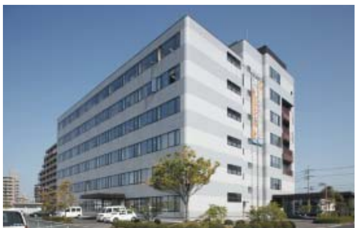
ミックが入居するビル。玄関からすぐにデスクに向かえるように、創業以来、常に1階にオフィスを構えている。

ミックの事業領域は「誰もがすぐに理解できる世界」ではない。むしろ「理解するのが難しい世界」である。だからこそ、資格を取得することで仕事を「面白い世界」に転換させたのだ。その一方で、新しい事業に挑戦したいという社員には積極的に起業させるとともに、資金