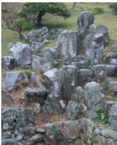
力強さが伝わってくる枯滝石組