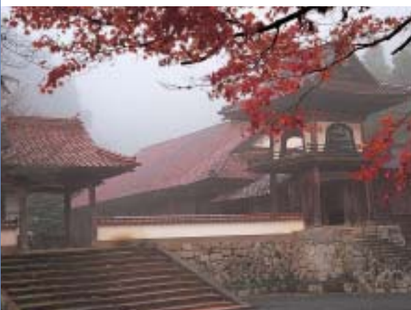
森鷗外も眠る永明寺