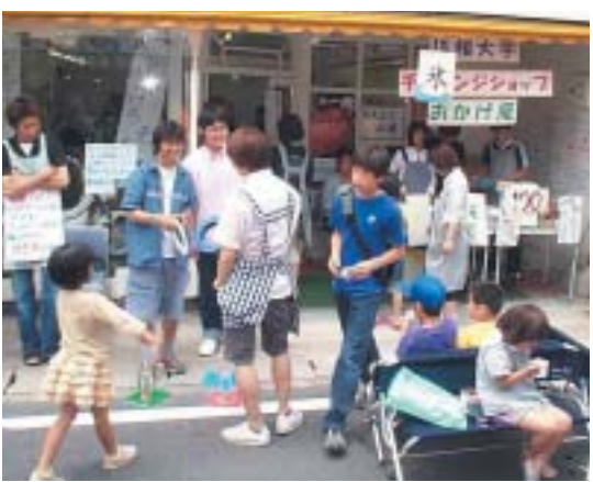
高齢者の商店街に「進出」してきた大学生たち

昔から地元の人たちに親しまれてきた天神町商店街は、そこに関わる人たちの輪を広げながら、より多くの人たちに愛される商店街に発展しようとしている。