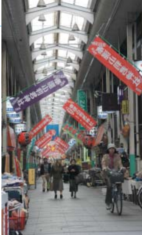
生活感があふれる奉還町商店街

奉還町商店街はもともと山陽道の一部であったが、廃藩置県により失職した池田藩の武士が大政奉還により手にした奉還金を元手に店を起したことに