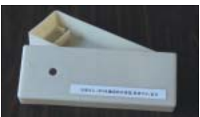
ほぼ100%植物由来のバイオプラスチックの「筆箱」

西川ゴム工業との共同研究をスタートさせる時に着目したのが天然ゴムであった。日常生活で使っている輪ゴムなど身の周りには天然ゴムも数多く使われている。特に、ゴム製品の開発に取り組んでいる西川ゴム工業にとって、環境を考えると天然ゴムに着目するのは必然的であった。その天然ゴムを軟質剤に使用すれば100%植物由来にできると考えたのだ。問題はポリ乳酸結晶と天然ゴムの界面がしっかりとつながるかどうかがあった。天然ゴムを使うと、相溶化剤との相互作用はこれまでに比べて低下してしまう。そこで、天然ゴムを改質したものを一部配合することとし、天然ゴムの配合比率や粒径などを変えて試験を繰り返した結果、界面の接着性が向上し、両