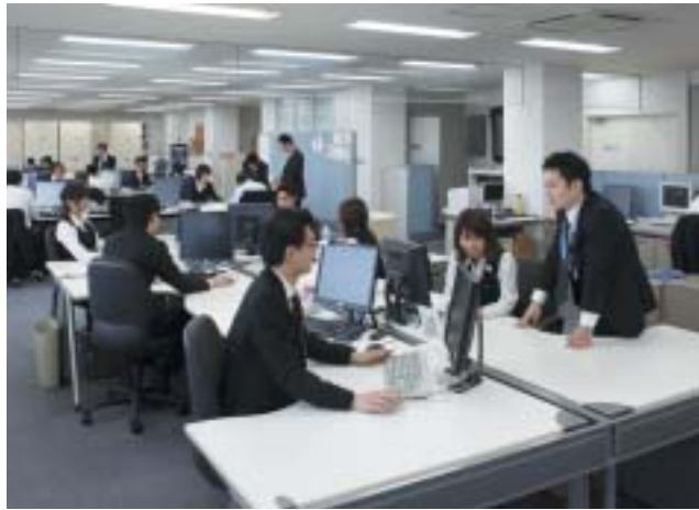
若い人たちの活気が満ちているオフィス

「社史のDVDもミック・デジタル・ハリウッドという社員のグループが制作したものです。このグループもインターネットでの表現を先駆的に研究しようと考えて設立したもので、研究内容などについてはメンバーに一任しています。『自由の中に規律を、規律の中に自由を』という言葉がありますが、自由と規律のバランスをとりながら社員の力を伸ばしていくのが経営者の仕事だと思います。」