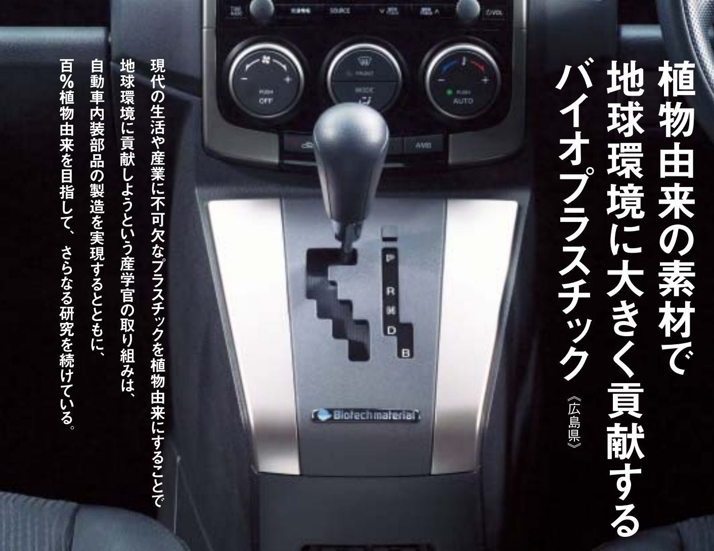
バイオプラスチックの内装部品を装備したマツダ車

現代の生活や産業に不可欠なプラスチックを植物由来にすることで、地球環境に貢献しようという産学官の取り組みは、自動車内装部品の製造を実現することでも、「100%植物由来を目指して、さらなる研究を続けている」。