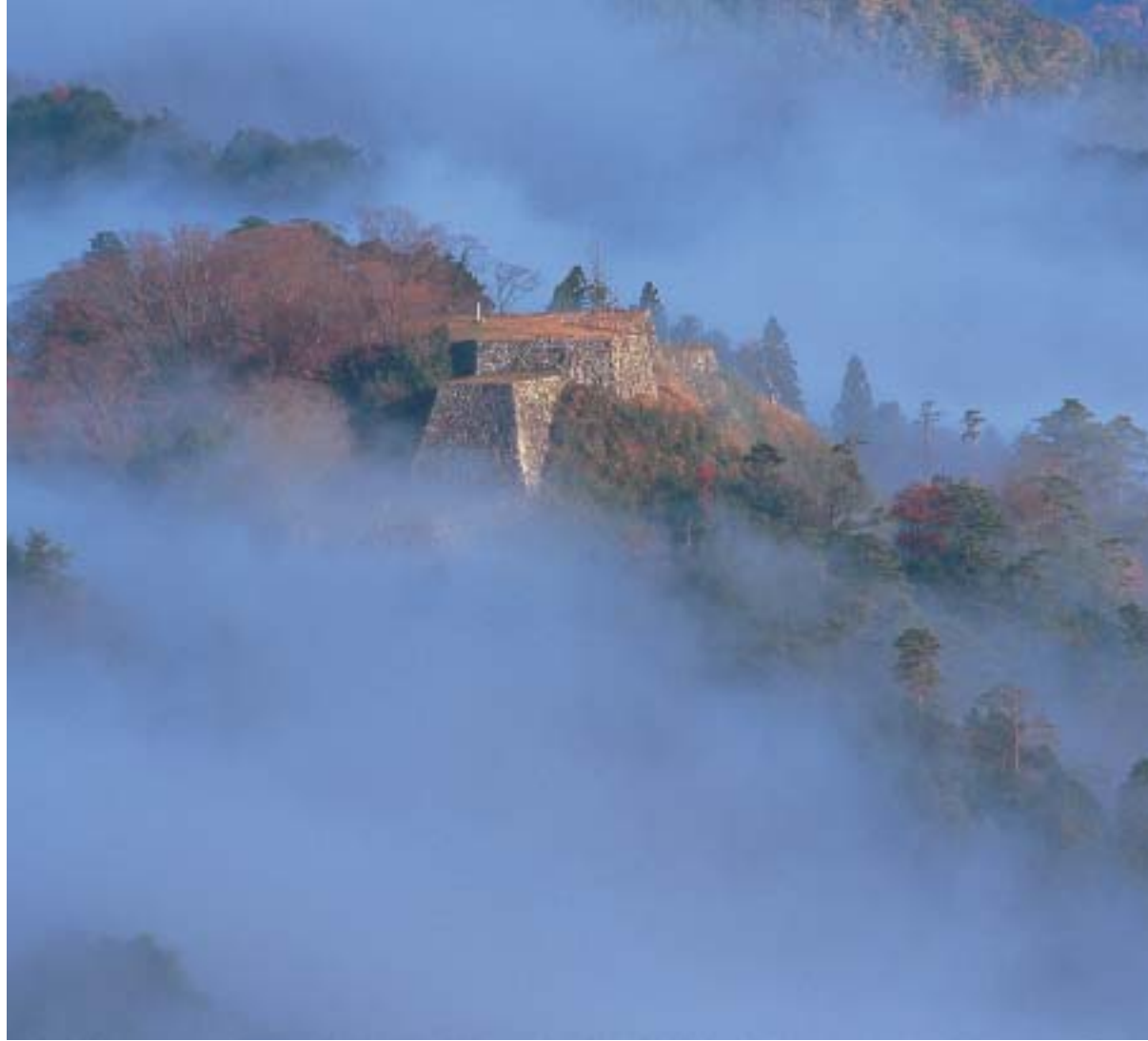
朝霧に包まれた津和野城址

坂崎氏の改易の後、鹿野（現・鳥取市鹿野町）から亀井政矩が四万三千石で移って津和野城主となった。政矩は入城後、山城である津和野城の地理の悪さを考え、日本海を望む高津（現・益田市）に新城の築城を計画したが、その折も折、広島藩の福島正則が幕府に無断で城を改修したために改易となる事件が起き、その影響で新城築城計画は断