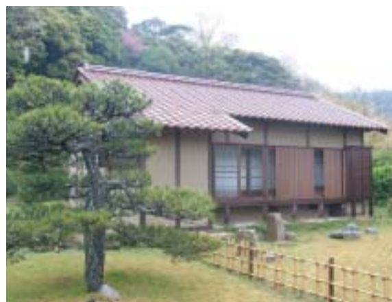
庭園を鑑賞できる書院