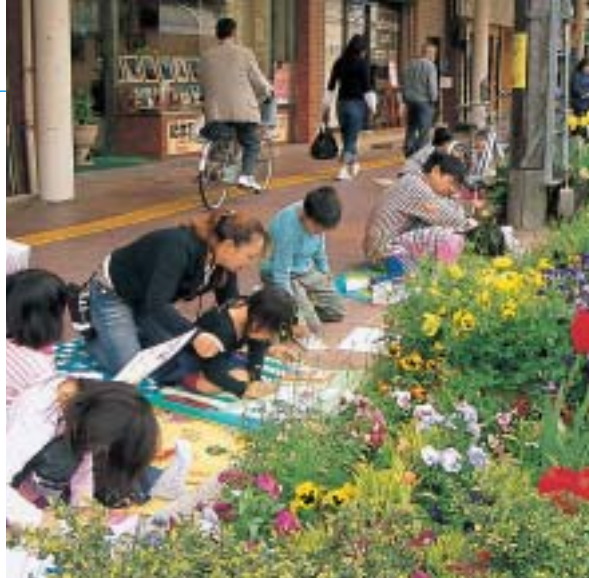
ゴールデンウィーク中に開催された写生大会

「ここまでがんばったのだから、もう少し辛抱しよう」「あと三年もたてば、きっと景気も良くなる」「昔ながらの商店街が見直されるときが来るんじゃないか」とみんなで声を掛け合い、目先の効果よりも数年後の未来に期待をかける。 (文・藤沢享乃・広島市在住)