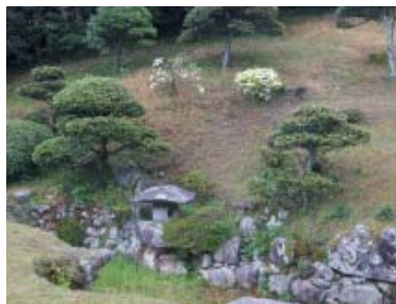
書院から眺める灯籠(とうろう)と龍頭石