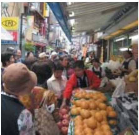
日常の楽しさを提供する小田原市のダイヤ商店街

ダイヤ街商店会は駅から徒歩五分の立地であるが、年々売り上げは減少し、にぎわいも低下するなど危機感が高まっていた。そうした中で再生に取り組むことになったのだが、最初に始めたことは「ドメインづくり」であった。ドメインとは自社の目指す事業領域、存在意義、提供価値のこと、それをほきり