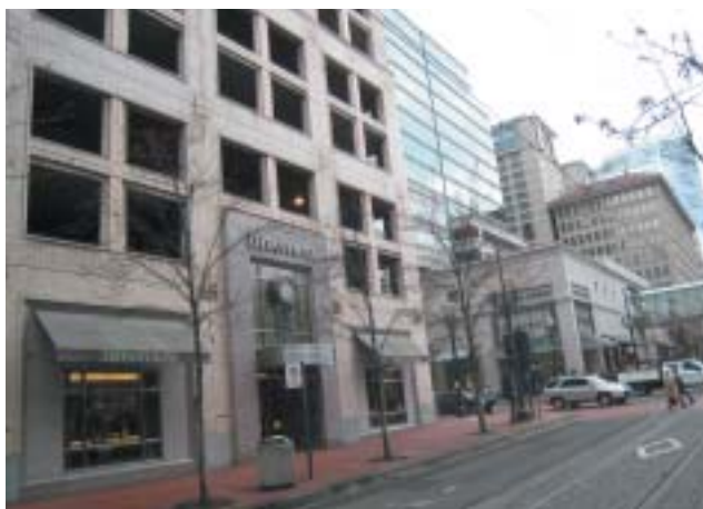
駐車場ビルに入居しているポートランドのティファニー

向上させている。ホームレスや刑期を終 えた軽犯罪者が社会復帰として清掃に 従事し、リタイアした警察官や警備員 などが街のパートタイムや観光案内を担っ ている。この運営には商工会議所が携わ っており、資金は街がにぎわうことで潤 うデベロパーがテナント料の一部を回し て負担している。