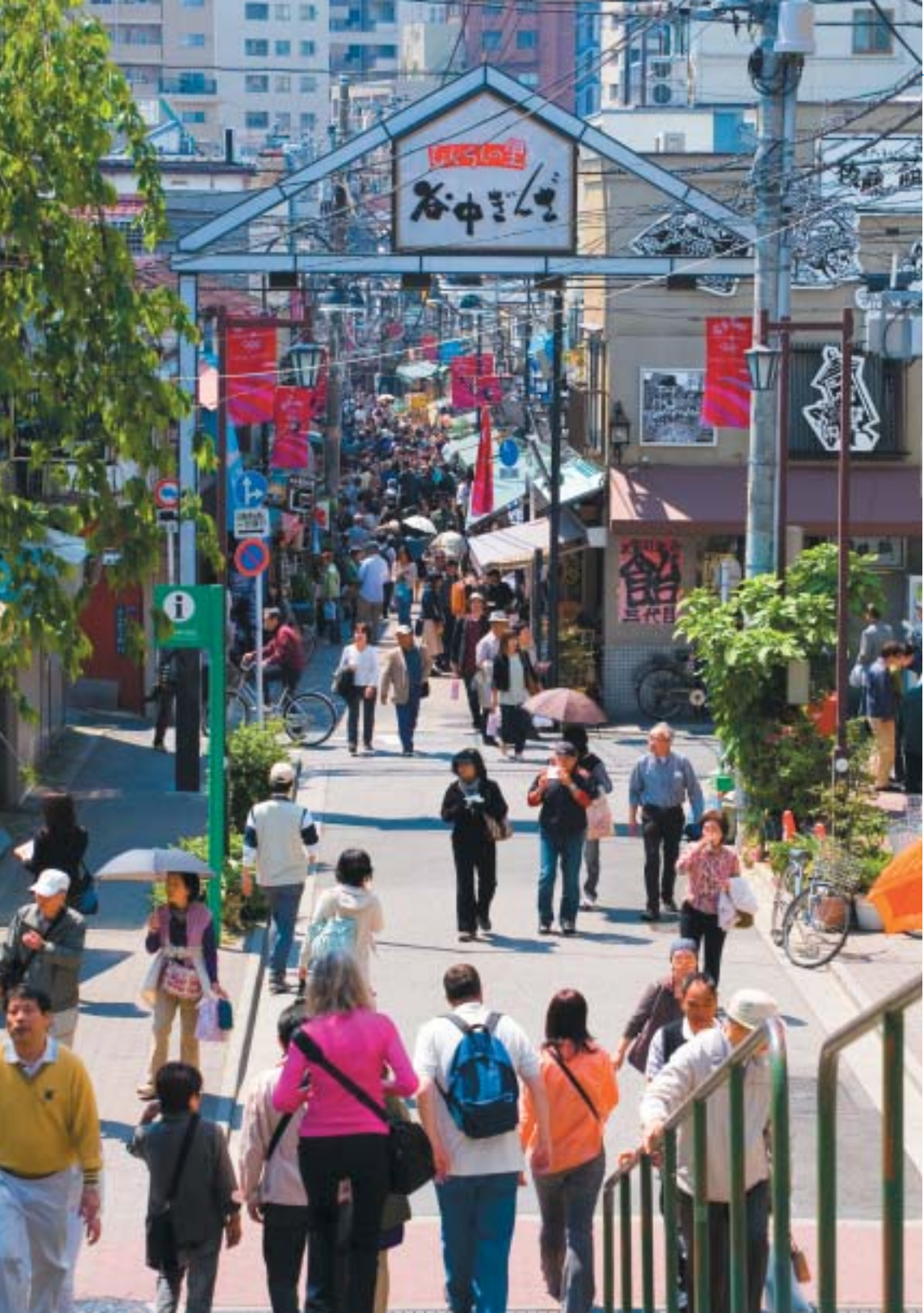
人気が高まっている東京・谷中の商店街

疲弊にあえぐ日本の商店街を再生するためには、まず「商店街のマインド」づくりが必要である。と同時に、人が集い、街がにぎわい、商業が潤う好循環を成立させる「仕組みづくり」に取り組むことが求められている。