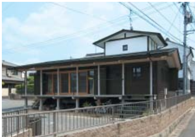
60人が収容できる「連塾」のセミナーハウス

こうして開塾した「連塾」は、岡山市北区京山の借地に建てた百三十坪、六十人収容のセミナーハウスで、十代から六十代まで一期生五十一人を迎えてスタートした。二〇〇五年四月のことだ。現在も、主婦、会社員、医師、公務員など職種も地域も多彩な塾生らがこぞ学ぶ。