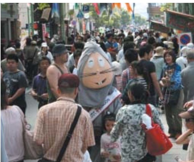
買い物客を迎える妖怪のぬいぐるみ

来年三月末からは、水木しげる氏の 奥さんである武良布枝さんをモデルとし た朝の連続ドラマがスタートする。地元 では観光客のさらなる増加を期待する とともに、訪れる人たちに満足して もらうための「仕掛け」づくりに取り組 もうとしている。来街者の満足度を高 め続けようという水木しげるロードの取 り組みはさらに本格化している。