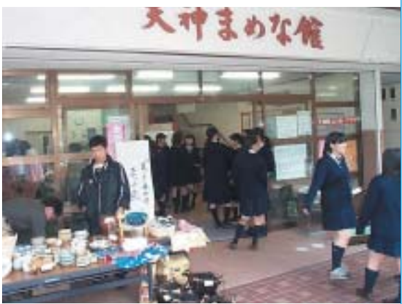
高齢者のボランティアが留守番をしている「天神まめな館」

また、商店街を中心とした「輪」を拡大するとともに、天神町商店街はできる限り負担を抑制しながらリアフリーにも積極的に取り組んでいった。その代表的な例が歩道と車道との段差の解消である。通常段差を解消するためには歩道を低くするが、それではお店の入り口との段差が生じ、商店の資金負担も高くなってしまう。そこで道路（県道）をかかさ上げすることで段差を解消した。