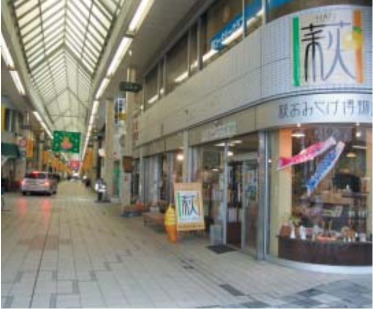
商店街の入り口にある「萩おみやげ博物館」

明治維新胎動の地として知られる山口県萩市の中心市街地にあるのが田町商店街である。江戸時代、田町商店街は萩往還の出発点であるとともに、城下のメインストリートでもあった。萩往還は参勤交代での御成道 おなりみち として開かれ