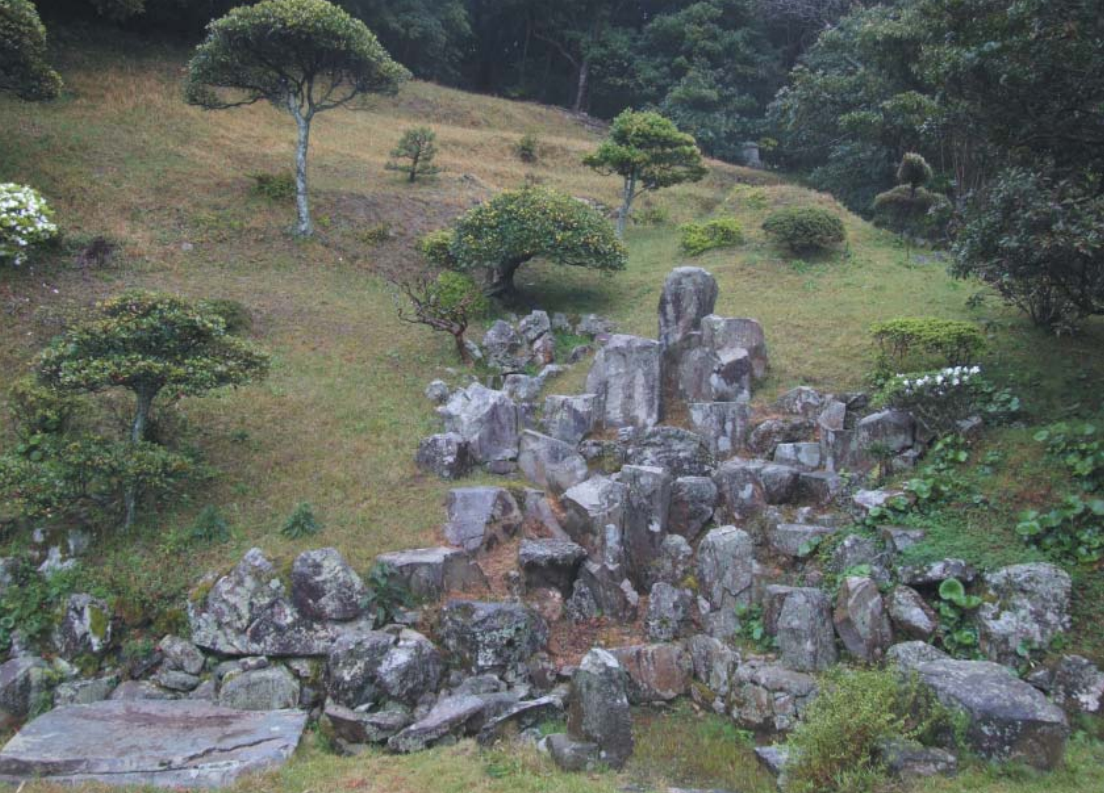
上部に枯滝石組、下部に水落の滝石組を配した庭

室町時代の古式な滝組の特徴でもある。一方で、西部の書院のある部分には大きく手が入って、池庭が埋め立てられるなど地割に変更が見られる。しかしながら、総じて個人所有の庭園で江戸時代の元禄をさかのぼるものはほとんどなく、その意味でも小川氏庭園や鳥取県米子市の深田氏庭園(「碧い風」60号参照)などは、そのままの姿を残した庭園として今日貴重な存在となっている。