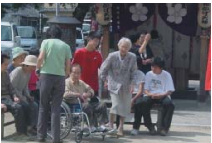
毎日多くの高齢者がお参りする「おかげ天神」

島根大学との交流が深まると、児童生徒の体験学習をしたいという申し出が小中学校からあった。それを受け入