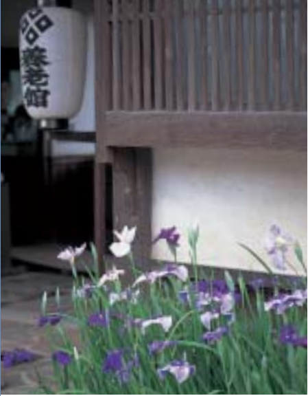
多くの人材を輩出した養老館

鷗外の墓は町内の永明寺にあるが、遺言により、ごく質素なものになつている。なお、同じ寺内には坂崎直盛の墓所もある。幕府の不興を買うのを恐れたのか、その銘は「坂崎出羽守」となつている。