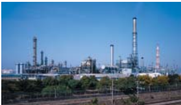
日本の化学産業を支える周南コンビナート