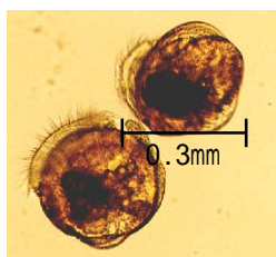
ムラサキイガイ成体（左）および付着期幼生（右）