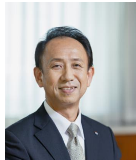
中国電力ネットワーク株式会社 代表取締役社長

私たちは新たな経営理念と経営ビジョンのもと、多様な人材が成長し活躍できる組織づくりを進めるとともに、柔軟かつ強固なネットワーク基盤を構築し、地域社会との共創を通じて、持続可能な社会の実現を目指します。