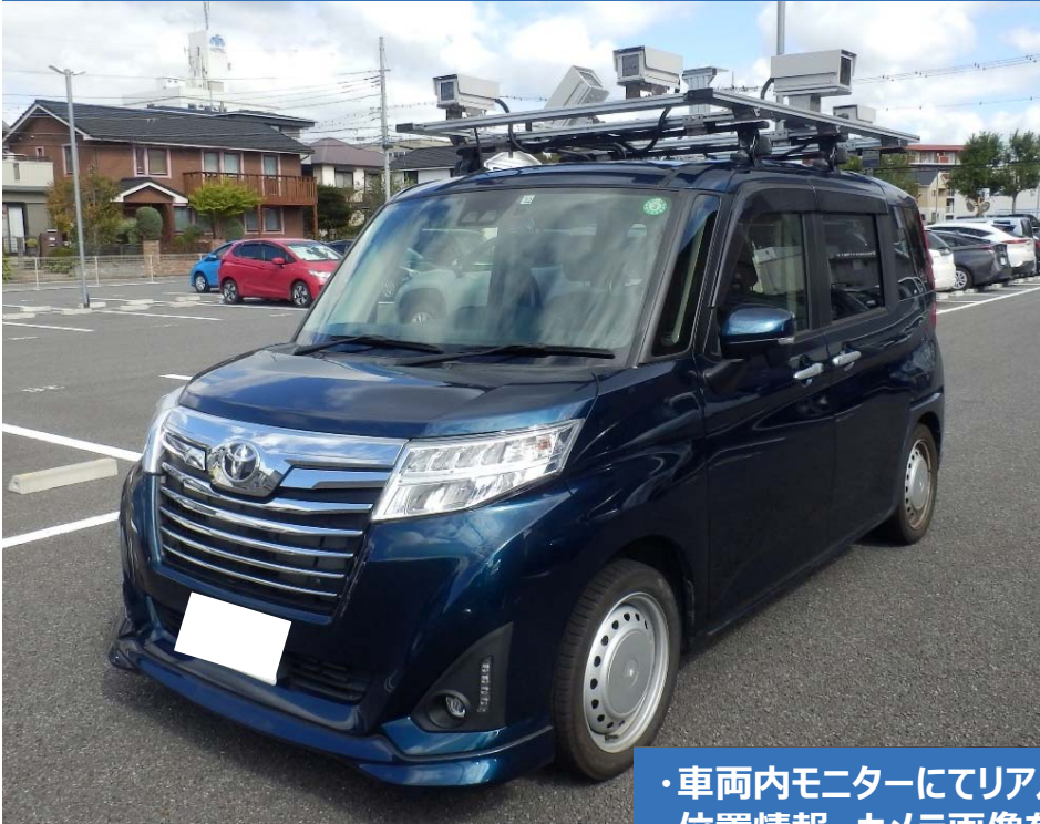
前後ステレオカメラ・側方カメラ・GPS 計6台のカメラを搭載