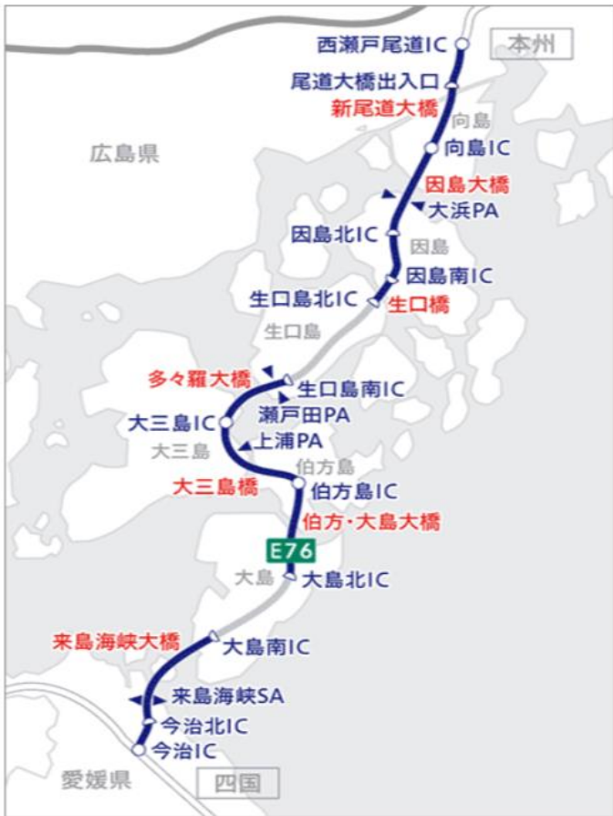
西瀬戸自動車道 (西瀬戸尾道IC～今治IC)