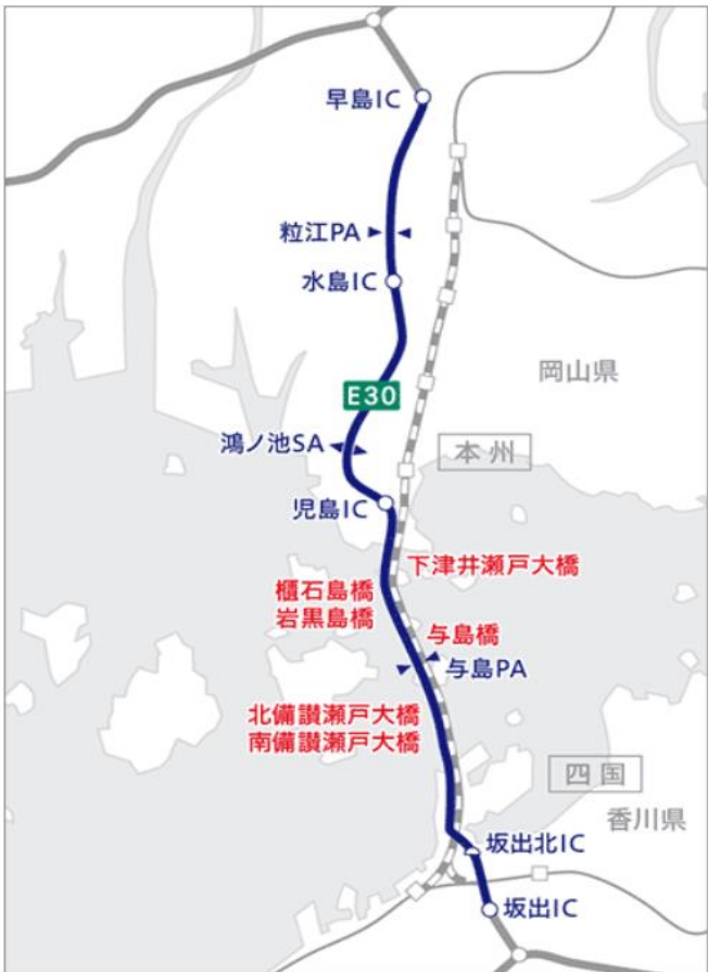
瀬戸中央自動車道 (早島IC～坂出IC)