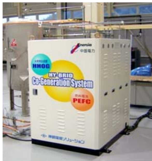
1kWハイブリッド式燃料電池コージェネレーションシステム 全体写真