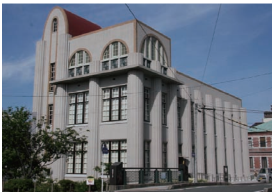
中国地方総合研究センター