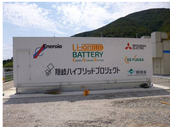
<リチウムイオン電池>