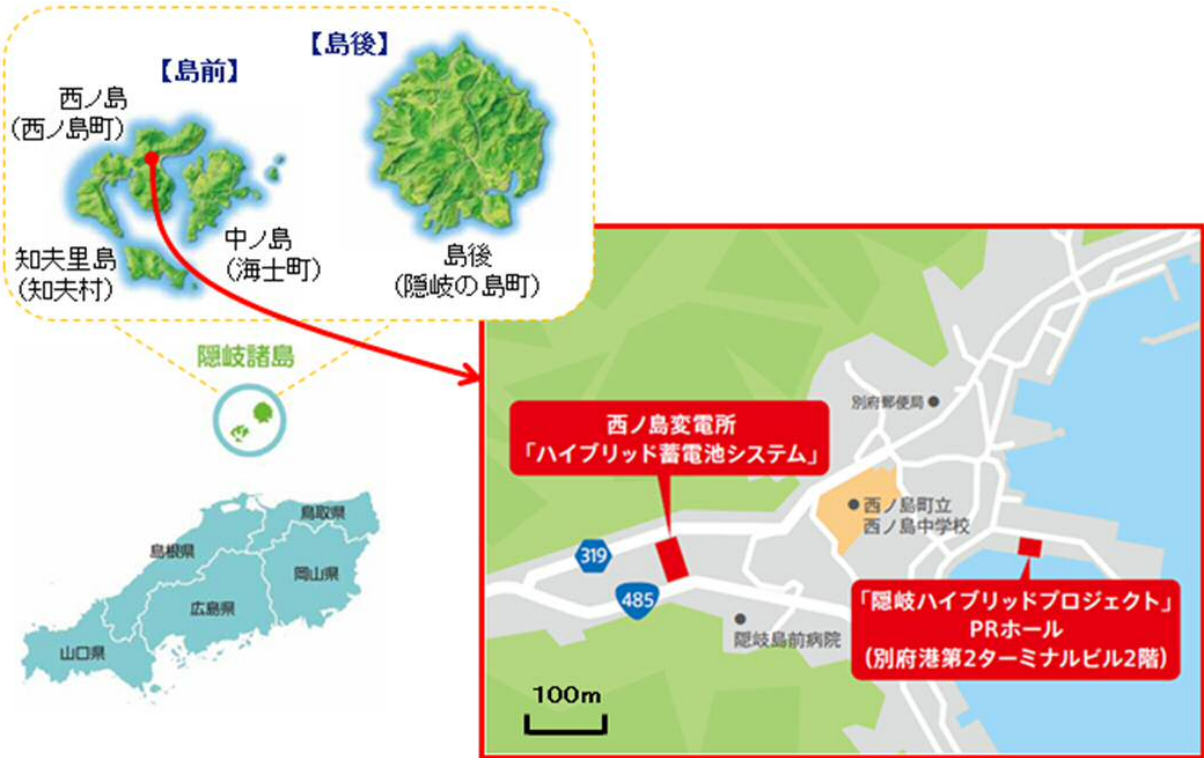
【西ノ島変電所 位置図】